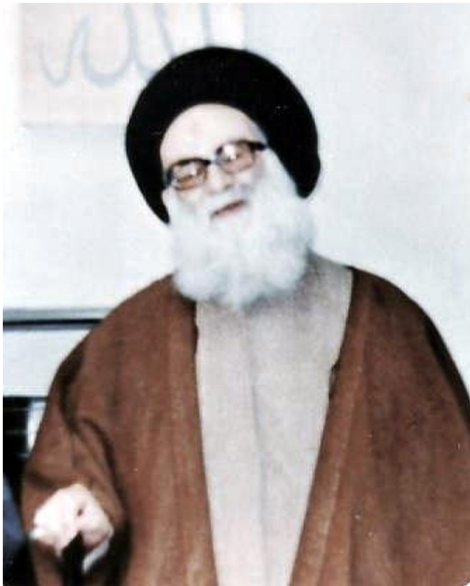
تصویر علامه طهرانی - قدس الله سره - در حسینیه منزل مسکونی (مشهد مقدس)